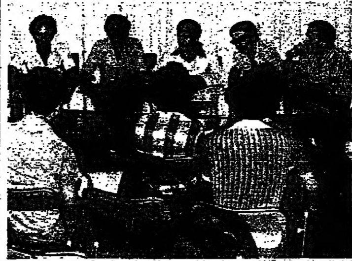
اجتماع شباب برنج اثناء المؤتمر الصحفي